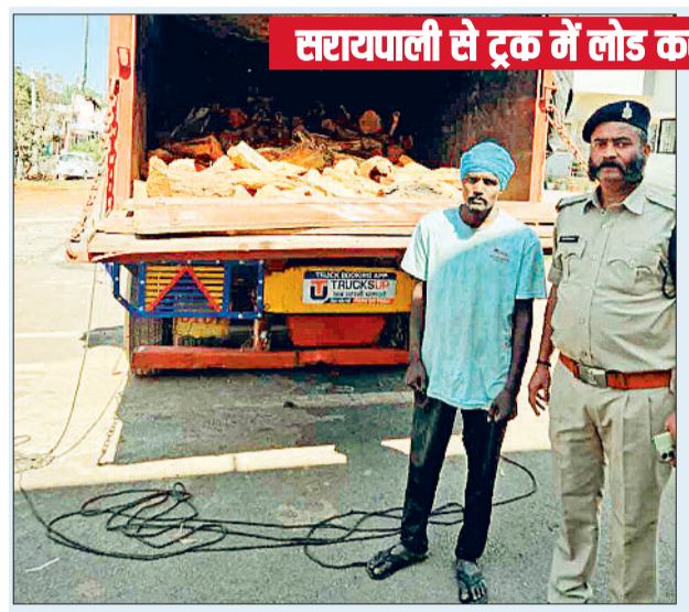
सरायपाली से ट्रक में लोड कराई गई थी खैर की लकड़ी

इस सूचना पर चित्तौरी पुलिस ने मामले की जानकारी तत्काल अपने वरिष्ठ अधिकारियों को दी और थाना क्षेत्र से गुजरने वाले नेशनल हाईवे में नाकाबंदी कर चित्तौरी की ओर आने वाले वाहनों की जांच शुरू कर दी। इसी दौरान पुलिस को मुखबीर द्वारा बताया गए नम्बर वाला ट्रक