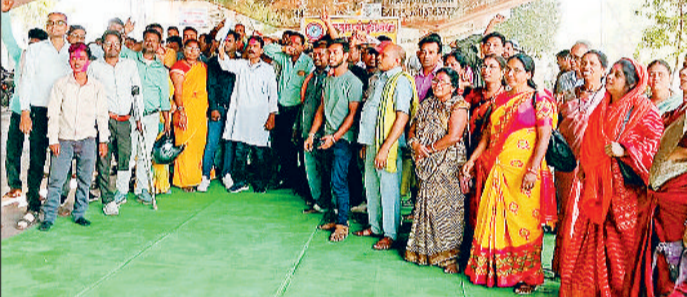
हरिभूमि न्यूज ►► डोंगरगढ़

आयुक्त को 16 बिंदुओं का ज्ञापन दिया था। एक माह से अधिक समय व्यतीत होने के बाद भी आयुक्त द्वारा कोई सकारात्मक कदम नहीं उठाया गया है। संघ ने आगामी 21 मार्च को आयुक्त का घेराव करना तय किया है। इसी दिन लोक निर्माण विभाग की आउट सोर्सिंग ठेका प्रथा के विरोध में प्रमुख अभियंता को ज्ञापन सौंपा जाएगा। पदाधिकारियों ने सभी से 21 मार्च को नया रायपुर पहुंचने का आह्वान किया है।